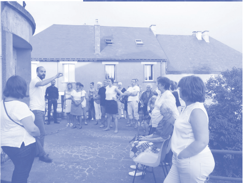
ÉTÉ 2017 : Une série de temps de travail avec les élus, les associations, des chefs d'entreprise, qui a permis de préciser les idées issues de l'atelier et qui s'est achevée par un moment festif à la maison « Baroin ».