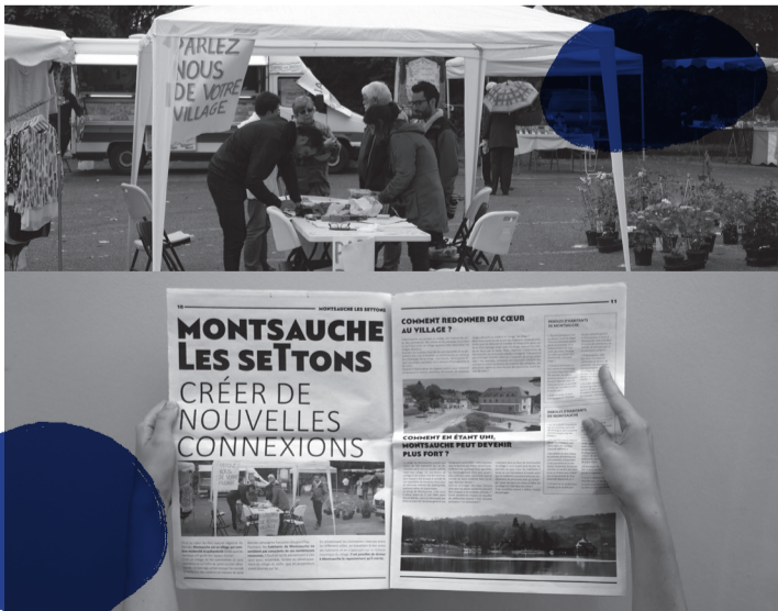
PRINTEMPS 2016 : Un premier temps de rencontres pour que l'équipe comprenne les enjeux spécifiques à chaque village et qui a donné lieu à la publication d'un journal « des bonnes nouvelles ».