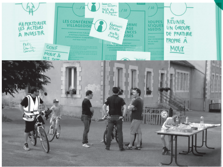
HIVER 2016-2017 : Un atelier participatif qui a permis de travailler les propositions d'aménagement du centre-bourg de Moux-en-Morvan.