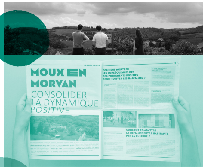
PRINTEMPS 2016 : Un premier temps de rencontres pour que l'équipe comprenne les enjeux spécifiques à chaque village et qui a donné lieu à la publication d'un journal « des bonnes nouvelles ».