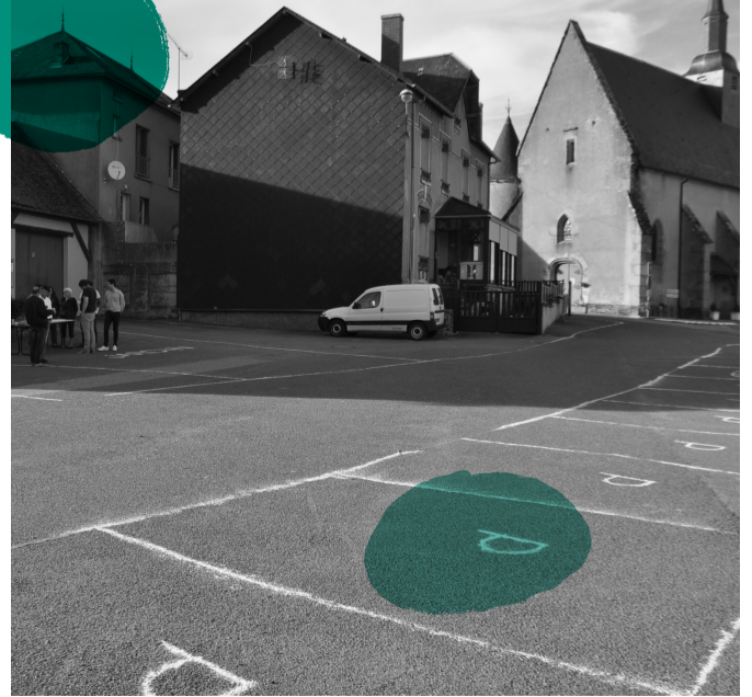
ÉTÉ 2017 : Une série de temps de travail avec les élus, les associations, des chefs d'entreprise, qui a permis de préciser les idées issues de l'atelier et qui s'est achevée par le dessin à l'échelle du futur réaménagement du parking.